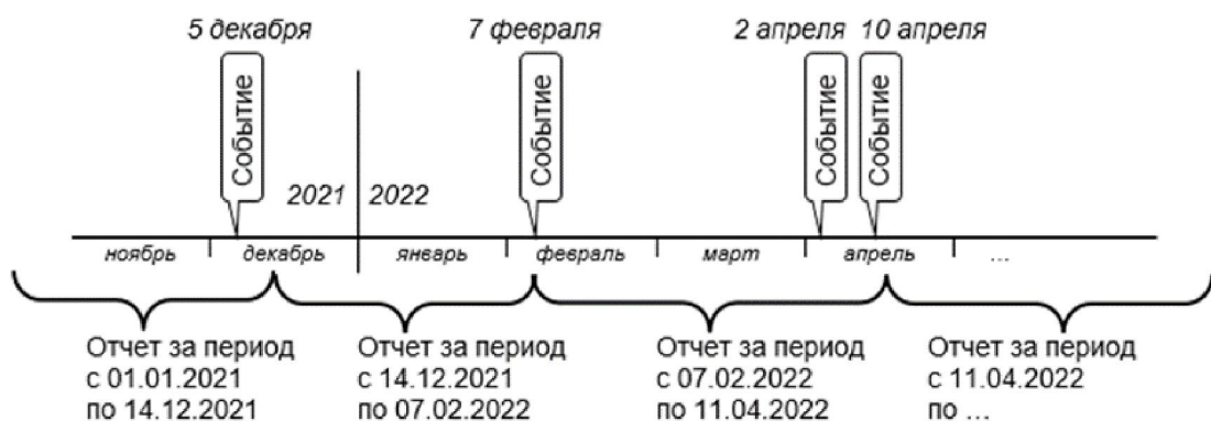
Рисунок 1. Схема определения даты окончания периодов оперативной отчетности

На рисунке 1 представлена схема определения даты окончания периодов оперативной отчетности.